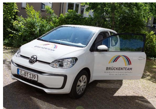
Abbildung 3: Brückenteam-Auto mit Logo

Mit den Brückenteam-Autos sind unsere Pflegekräfte mobil und können die betroffenen Kinder ambulant im eigenen Zuhause versorgen. Dank teilgesponsertem Branding von BIGHA Folierung erkennt man unser Team auch im Vorbeifahren.