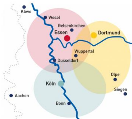
Abbildung 2: Versorgungsgebiet der Brückenteams

In Zukunft werden alle Brückenteams des Klinikums Dortmund, der Uniklinik Köln und des Universitätsklinikums Essen zentral vom Standort Essen aus koordiniert.